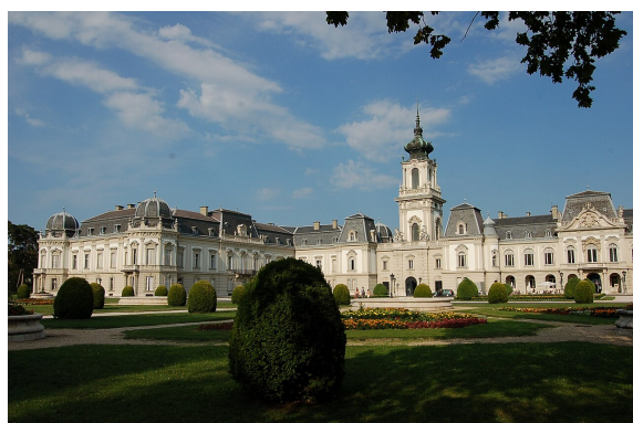
Keszthely Festetics Schloss Gartenseite