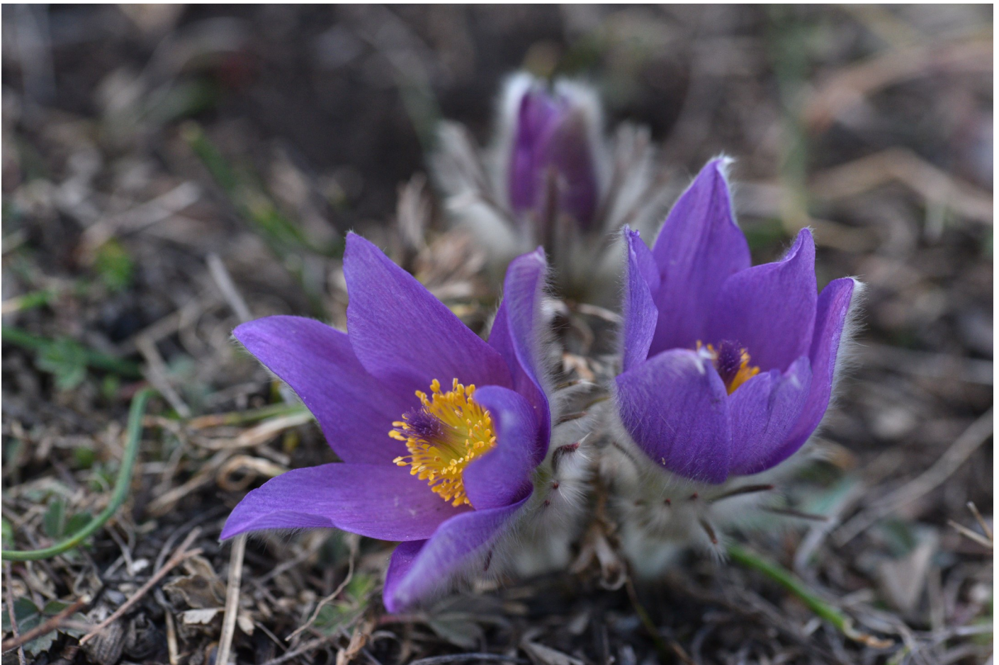
Fotografiert an einem 4. März von Peter Schleißner

WIR WÜNSCHEN IHNEN ALLEN FROHE OSTERN, DER VORSTAND DES SENIORENBUNDES UND DIE REDAKTION DES SENIORENKURIER